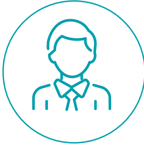
أي شخص بالغ تثق به